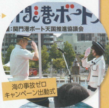
海の事故ゼロ キャンペーン出動式