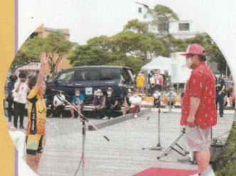
SWIM & RUN

◀◀ 門司港レトロ地区と関門港門司区 ▶▶ ◀◀ 第1船だまり及びその付近海域 ▶▶